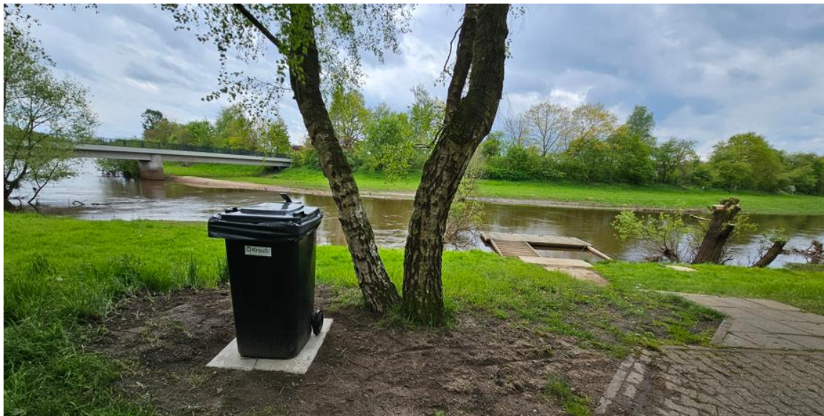
Bootsanleger Stadt Haselünne (oben)